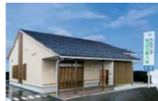
想送会館 六家 高岡市六家字畑田1216番 ☎0766-53-4222