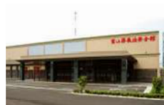
富山葬儀法要会館 富山市豊田町1-4-27 ☎076-432-4440