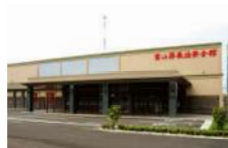
富山葬儀法要会館 富山市豊田町1-4-27 ☎076-432-4440